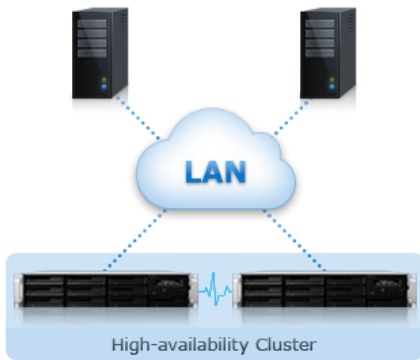
Figure 1) Fiabilité, disponibilité et récupération d'urgence

Synology High Availability assure une transition transparente entre les serveurs en cluster en cas de panne du serveur avec un impact minimal pour les entreprises.